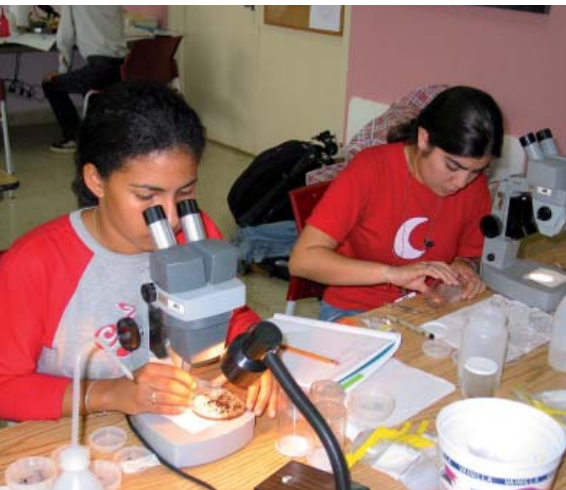
Tri par des étudiants panaméens d'insectes collectés en forêt

les existent. Je les encourage tous à tenir bon et j'insiste sur le fait que ceux qui ont vraiment la foi réussiront, quel que soit le moyen. » D'autant que les débouchés existent, insiste L. Pelozuelo : « les entomologistes compétents sont recherchés dans les bureaux d'études et les associations pour peu qu'ils soient aussi capables d'écrire des rapports, d'animer des réseaux, de participer à des réunions avec des administratifs, etc. ». Sans doute un des secteurs d'emplois les plus porteurs actuellement en entomologie. ■