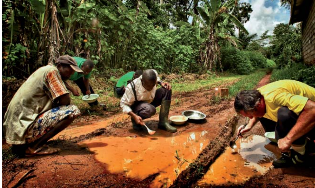
Des entomologistes médicaux collectent sur le terrain les larves d' Anopheles gambiae , principal moustique vecteur du paludisme en Afrique, à partir de flaques d'eau de pluie situées sur une piste dans la forêt tropicale du centre du Cameroun.